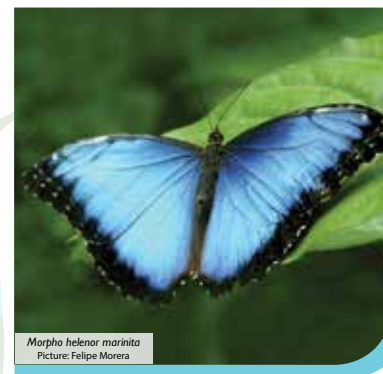
Morpho helenor marinita

El Teñidero: This site is very popular and is where the blue hue of the river begins. About 22 miles (36 km) in length, the visitor is captivated by the river that starts colorless then suddenly turns sky blue. This site is located one hour from the Park's administration along the "Misterios del Tenorio" Trail.