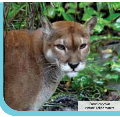
Puma concolor