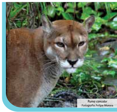
Puma concolor