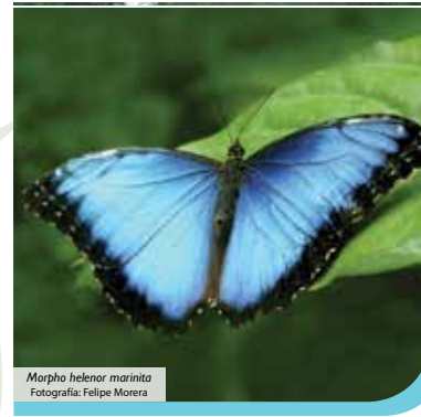
Morpho helenor marinita

El Teñidero: Es un sitio muy popular donde se inicia el fenómeno que da la coloración celeste al río en un recorrido aproximado de 36 km. Llama la atención del visitante pues el agua incolora de repente cambia a color celeste.